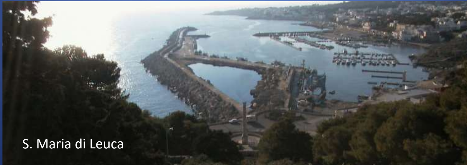
S. Maria di Leuca